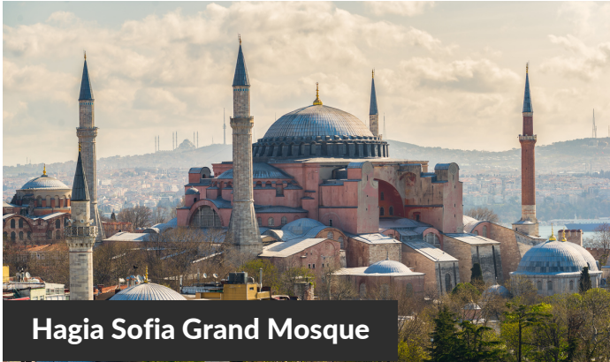
Hagia Sofia Grand Mosque