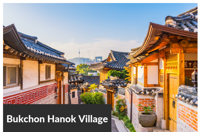
Bukchon Hanok Village